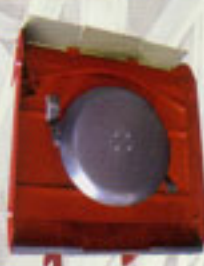
Cubierta de la segadora con posibilidad de ejecutar la placa en altura