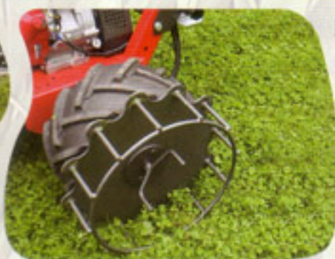
Zarpas metálicas para pendientes extremas