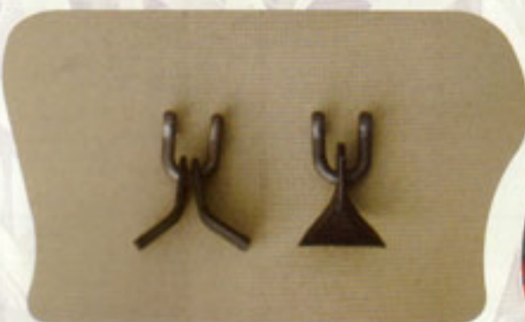
Opcionalmente cualquier corte