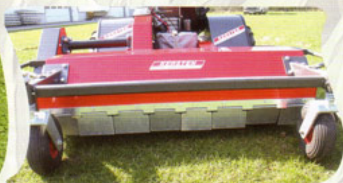
Protector de peatones y operarios