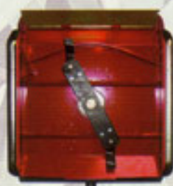
Cubierta de la segadora con posibilidad de ejecutar los corredores en altura